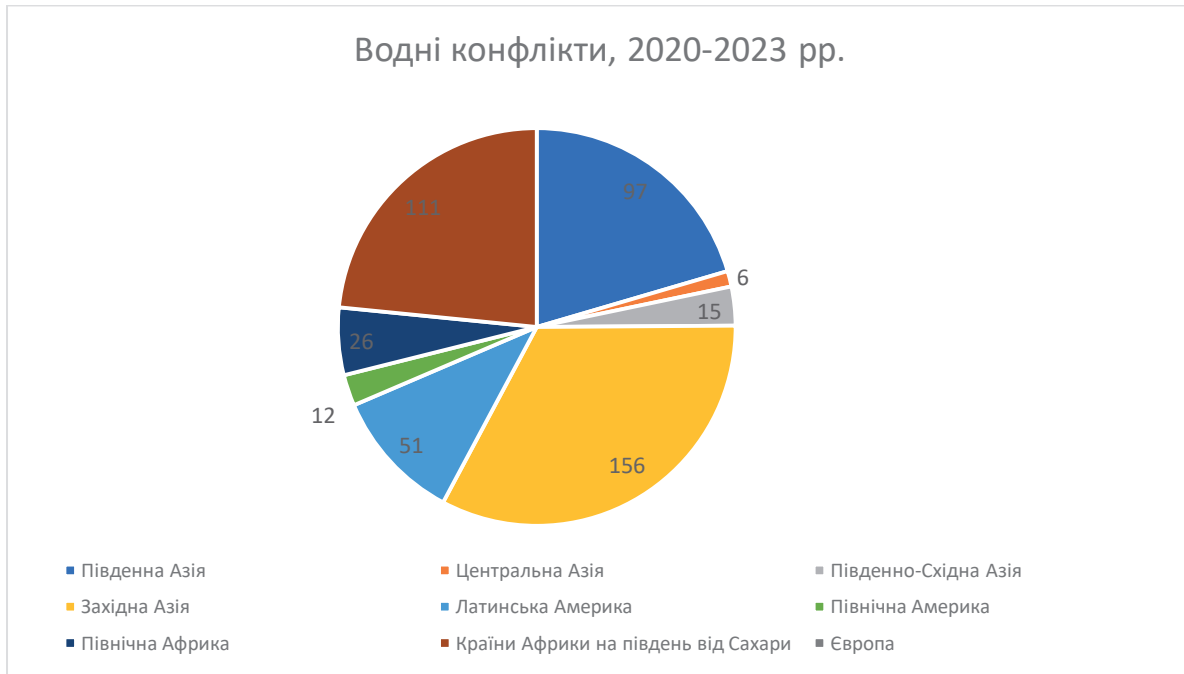
Рис. 1. Водні конфлікти у світі, 2020-2023 рр.

дефіцитну воду. Тож вододефіцитні країни/регіони часто стикаються із загрозою виникнення водних конфліктів. Тип вода як «зброя» передбачає використання водних ресурсів як зняряддя у збройному конфлікті.