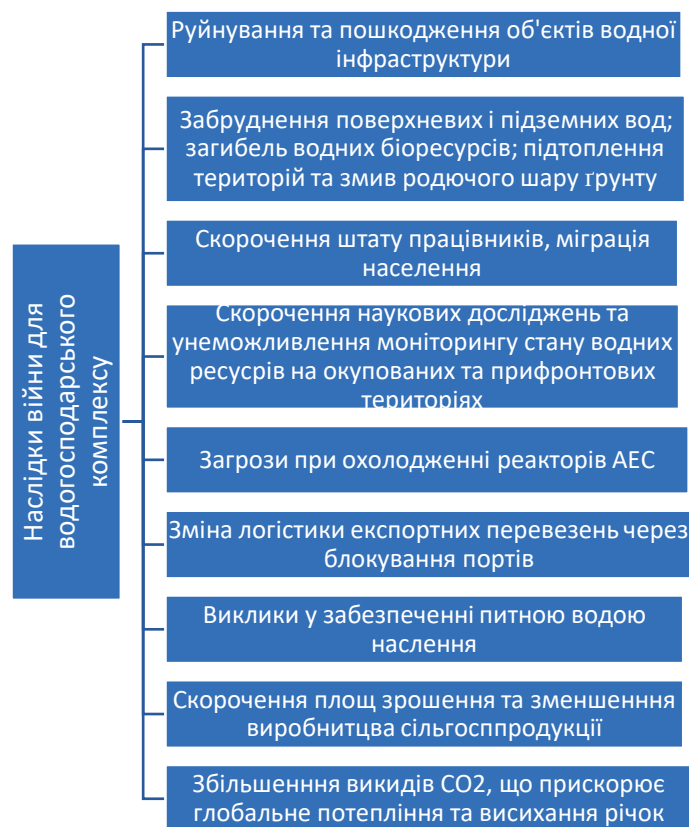
Рис. 3. Наслідки воєнних дій для водогосподарського комплексу

Отже, водогосподарський комплекс України у воєнний період зазнає потужного негативного впливу, наслідки якого узагальнено нижче (рис. 3.).