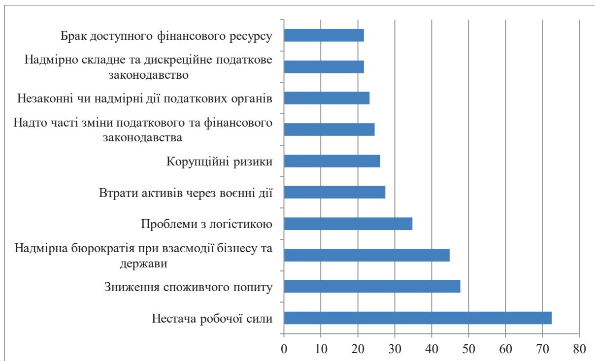
Рис. 3. Результати опитування респондентів щодо причин, котрі заважають розвивати їх бізнес

сталого розвитку та цифрової трансформації малого та середнього підприємництва до 2027 р. [14], не передбачено вирішення більшості з визначених потреб. Це означає, що вони будуть і надалі зростати.