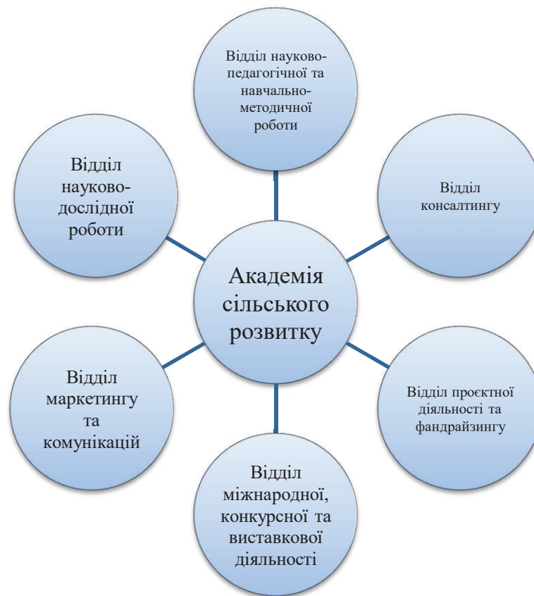
Рис. 1. Організаційна структура Академії сільського розвитку ГО «Спілка сприяння розвитку сільського зеленого туризму в Україні»

В межах наукового дослідження вбачаємо за доцільне схарактеризувати консалтингову діяльність Академії.