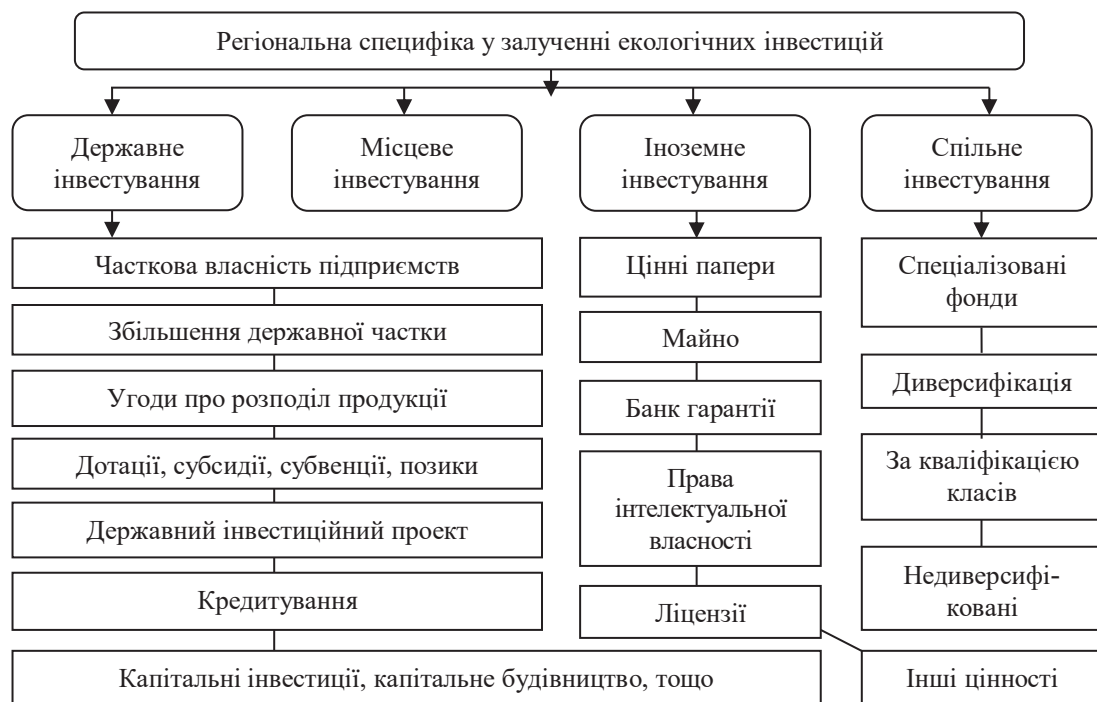
Рис. 1. Класифікація екологічних інвестицій за регіональною специфікою

Вивчаючи питання екологічних інвестицій, багато науковців підкреслюють, що зелене інвестування є важливим фактором у фінансуванні майбутніх проєктів. Воно не лише сприяє розвитку фінансових ресурсів, а й допомагає досягати глобальних цілей сталого розвитку. Уряди активно співпрацюють у цьому напрямі, зосереджуючи свої зусилля на зелених інвестиціях. Проводячи дослідження в цій галузі, можна виявити певну класифікацію фінансування, що допоможе краще розуміти їх вплив на екологічну стійкість та економічний зріст (рис. 1, 2).