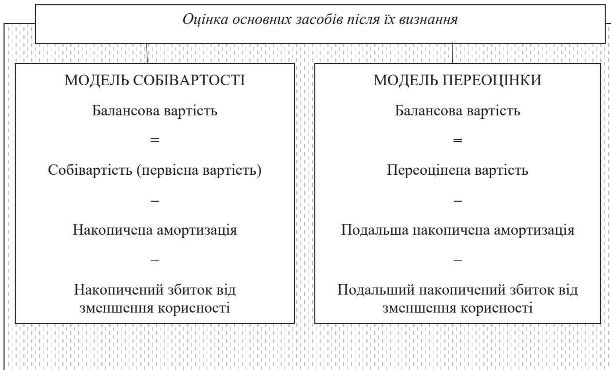
Рис. 3. Оцінка основних засобів після їх визнання

Після первісного визнання до об'єкта основних засобів застосовують модель подальшої оцінки, яку закріплюють своєю обліковою політикою, яка існує за двома моделями: модель собівартості та модель переоцінки (для основних засобів, залишкова вартість яких суттєво відрізняється від його справедливої вартості, яку можна достовірно оцінити) (рис. 3). Для різних класів основних засобів можна вибрати різні моделі подальшої оцінки.