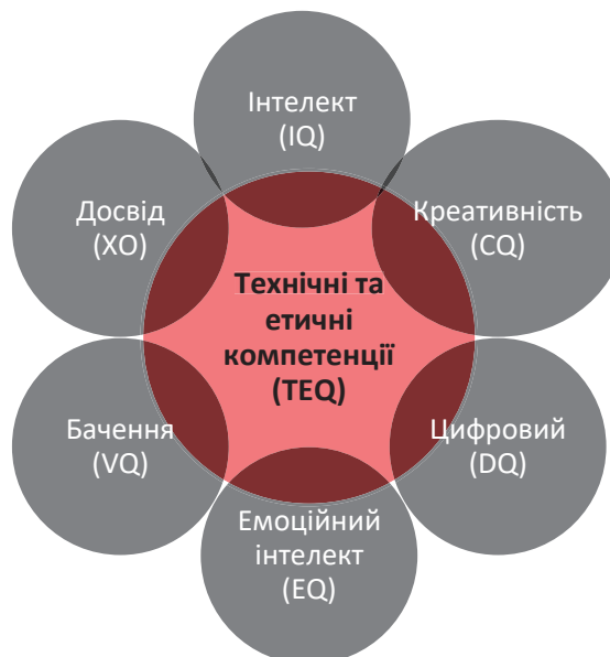
Рис. 1 Професійні коефіцієнти успіху

АССА визначила сім коефіцієнтів, які професійні бухгалтери повинні розвивати, щоб вони могли процвітати в середовищі, яке складається з цих чотирьох взаємопов'язаних рушійних сил змін (рис. 1).