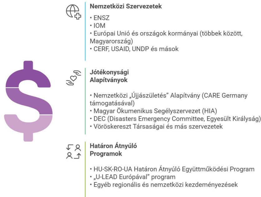
2. ábra. Nemzetközi donorok és támogatási programok Kárpátalján (2022–2024).*

készpénzben fizették ki az Ukrán Posta (Ukrposhta) fiókjain keresztül, és 2220 hrvnyát tett ki személyenként, havonta, több hónapon keresztül.