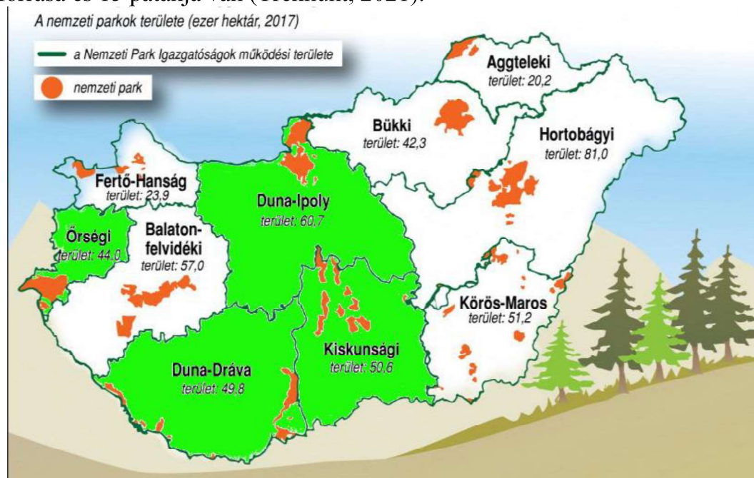
2. ábra: Magyarország nemzeti parkjainak működési területe (zöld színnel kiemelve a primer kutatásba bevontakat)

és a Szentgyörgyvölgy környékét. A park egy dombsági területen található, több mint 200 forrása és 15 patakja van (Trekhunt, 2021).